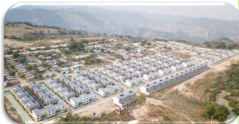
FONDO ADAPTACIÓN MAGANGUE URB VILLA JULIANA II 452 VIVIENDAS ENTREGADAS