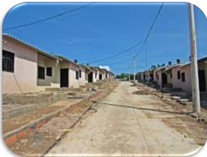
MINISTERIO DE VIVIENDA SANTA ROSA DEL SUR URB 20 DE JULIO 120 VIVIENDAS