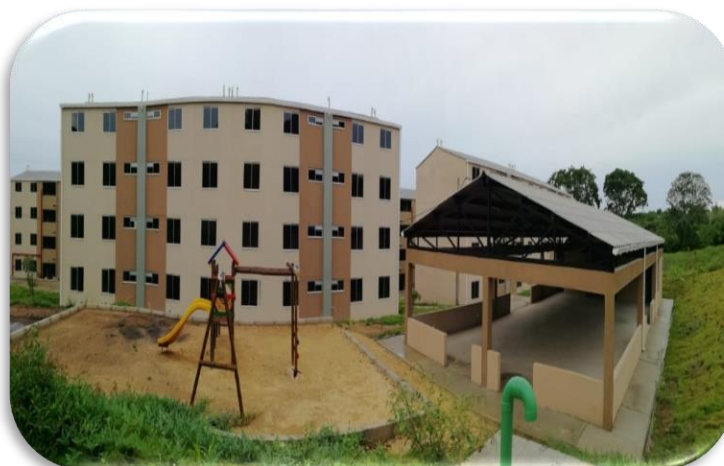
MINISTERIO DE VIVIENDA TURBANA URB VILLAS DE GUADALUPE 200 VIVIENDAS