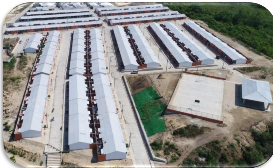
MINISTERIO DE VIVIENDA TURBACO URB ORO BLANCO II 212 VIVIENDAS