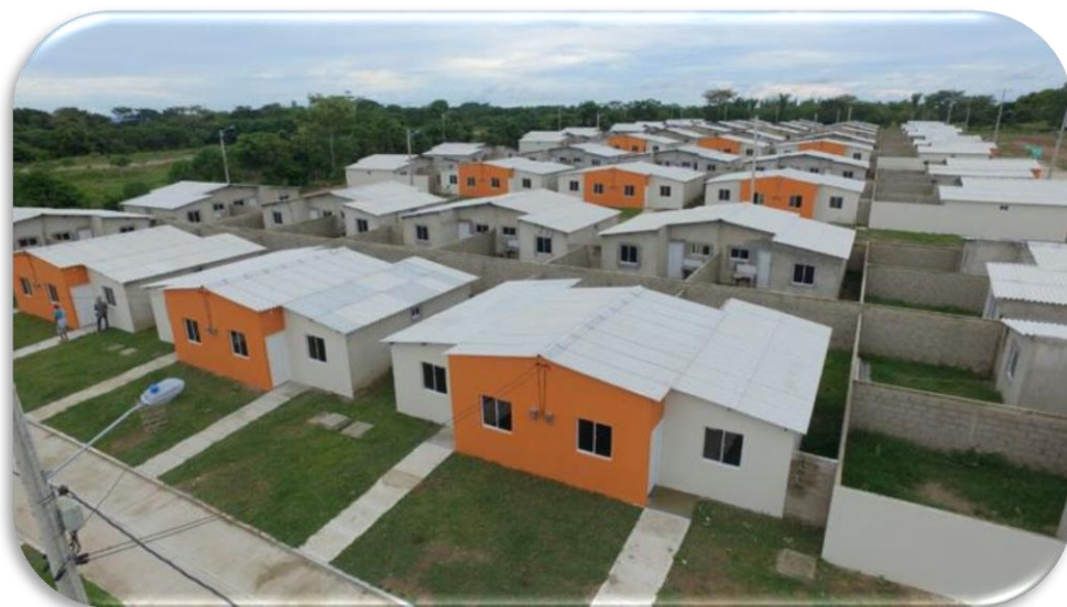
FONDO ADAPTACIÓN CICUCO URB VILLA TORRES 120 VIVIENDAS