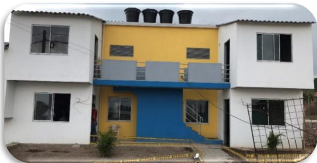
FONDO ADAPTACIÓN SANTA ROSA DEL SUR URB VILLA PAULA 480 VIVIENDAS