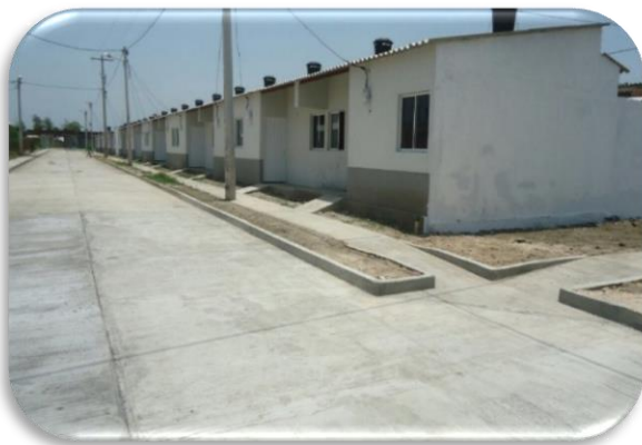
MINISTERIO DE VIVIENDA REGIDOR URB VILLA LIDER 100 VIVIENDAS