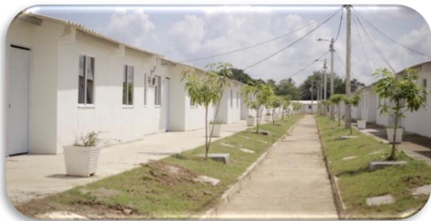
FONDO ADAPTACIÓN MOMPOX URB VILLAS DE MOMPÓX 665 VIVIENDAS