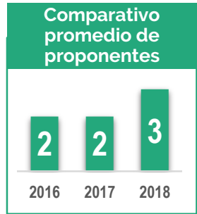
Objetos contractuales: ¿Qué se contrató por licitación pública?